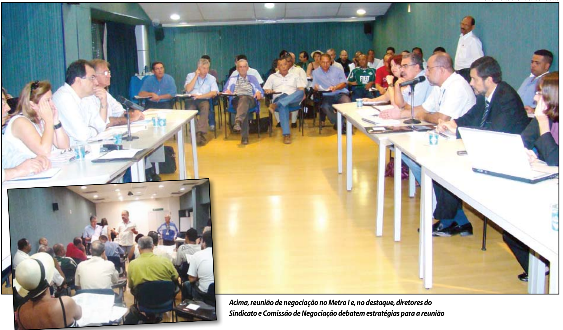
Acima, reunião de negociação no Metro I e, no destaque, diretores do Sindicato e Comissão de Negociação debatem estratégias para a reunião

Na segunda reunião da campanha salarial, ocorrida nesta quarta-feira, 13/05, a empresa se comprometeu a renovar todas as cláusulas pré-existentes relacionadas aos benefícios sociais. Uma alteração é com relação ao auxílio funeral, que passaria a ser de R$ 3 mil. A próxima reunião acontecerá na sexta-feira, 15/05, às 9h, no Hotel Excelsior, quando serão discutidas as cláusulas relacionadas à higiene, segurança e medicina do trabalho